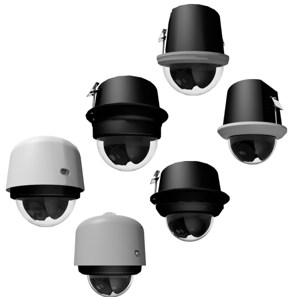
Dome-Modelle (S7230L und S7818L)