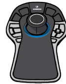
Enhanced 3D Mouse