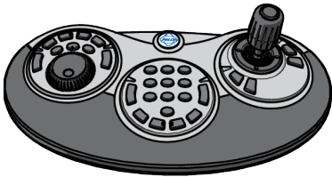
KBD5000 Jog/Shuttle, Keypad, and Joystick